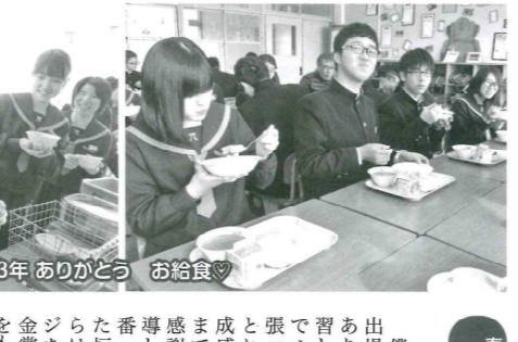
3年 ありがとう お給食